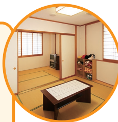
介護者教室・相談室