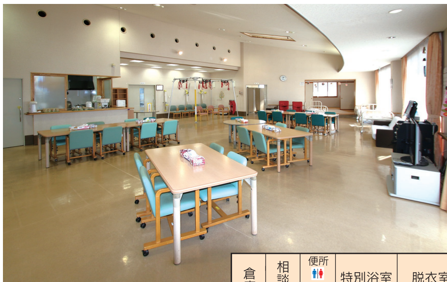
太田市新田デイホール

家庭におられる寝たきりや障害のあるお年寄りに通所していただき、食事や入浴など各種の介護サービスを提供し、日中の数時間を施設にてお過ごしいただき、お年寄りの孤独感からの開放、心身機能の向上、また家族の心身のご苦勞の軽減を図ることを目的としています。