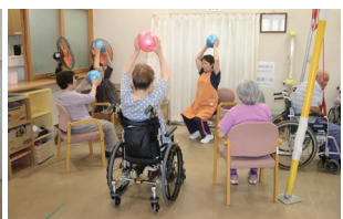
筋力トレーニング