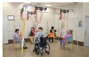
腕のストレッチ運動