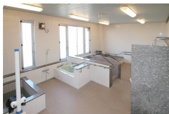
一般浴室(リフト浴)